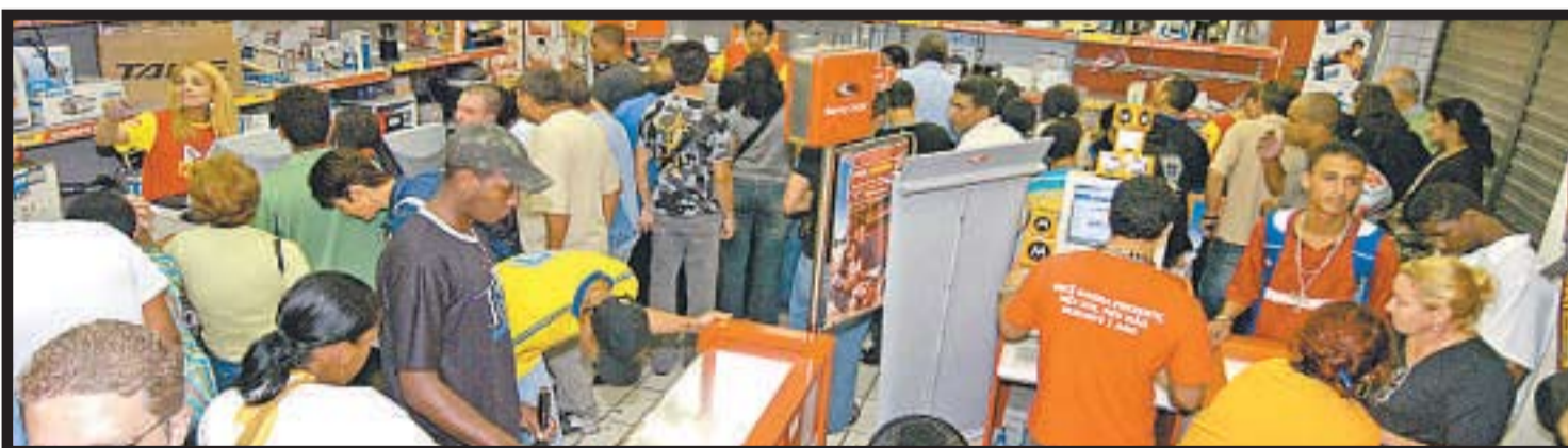
Liquidação loja de varejo de Belo Horizonte: alvo do governo é mercado interno, responsável pelo crescimento do país no ano passado

sumo com o aumento de R$ 50. “O aumento do salário mínimo tende a proteger o mercado interno, que nos últimos anos tem sustentado o crescimento da economia no país e gerado o maior número de empregos”, observa Rodarte.