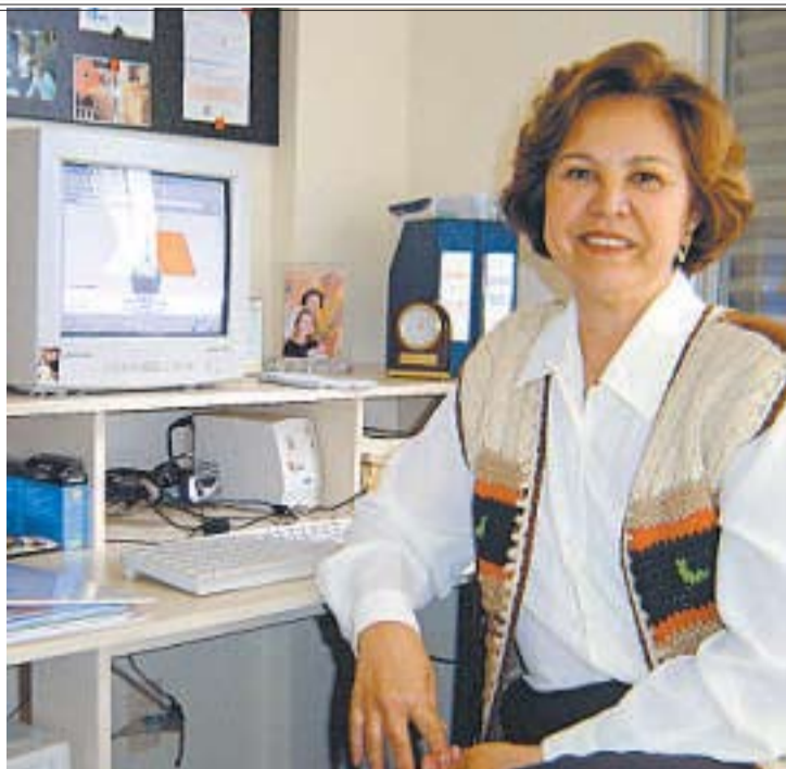
RAQUEL FREITAS/DIVULGAÇÃO - 29/3/07